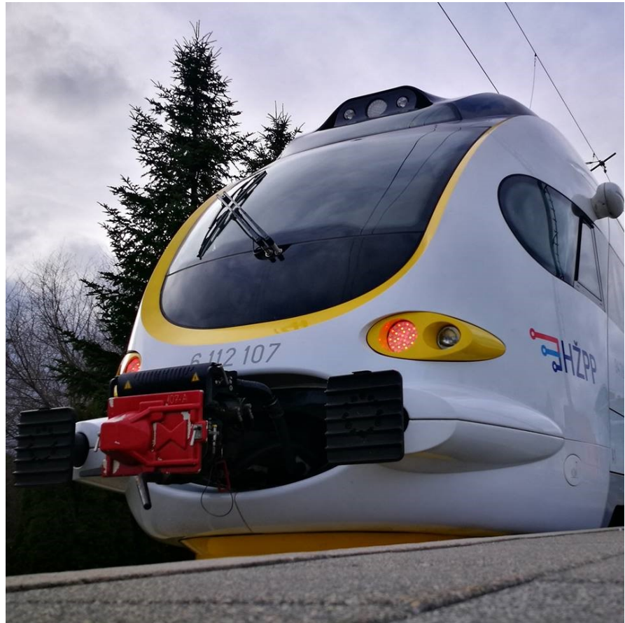
Autor: Ivan Tuk

Iznimno je bitno da nakon stvaranja zračnog prostora, stvorimo i jedinstveni željeznički prostor Europske unije. Razvijenost infrastrukture željezničkog sektora ključna je za konkurentnost, proizvodnju, zapošljavanje i rast gospodarstva, a tome i povezivanje gospodarstvenika regije. Željeznica mora biti generator i potaknuti razvoj željezničke industrije, a to može pridonijeti i rastu ekonomije. Na važnost buduće velike uloge koju će željeznica tek izgrati ukazuje već dosad uloženi