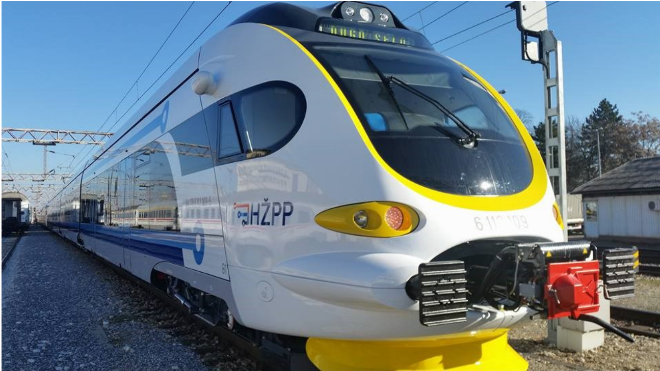
Autor: Ivan Tuk

Uz sustavni razvoj adekvatnog bržeg i konforrijeg prijevoza, hrvatski turizam može postati jedan od generatora razvoja gospodarstva. Balansirajući socijalne, ekonomske i čimbenike zaštite okoliša, dolazimo do činjenice kako je održivi razvoj skladan odnos ekologije i gospodarstva te predstavlja težnju za boljim svijetom, kako bi se prirodno bogatstvo naše planete sačuvalo i za buduće naraštaje.